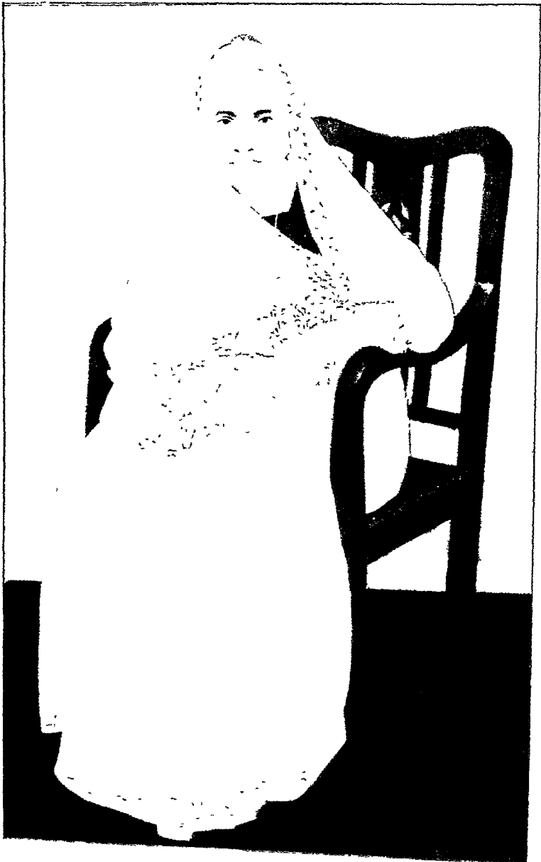
स्वर्गाय मूर्तिदेवी, मानेध्वरी साहू शान्तिप्रसाद जैन